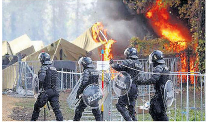
Kuva: Massamuutto on TUHOAMASSA Euroopan juuri nyt!